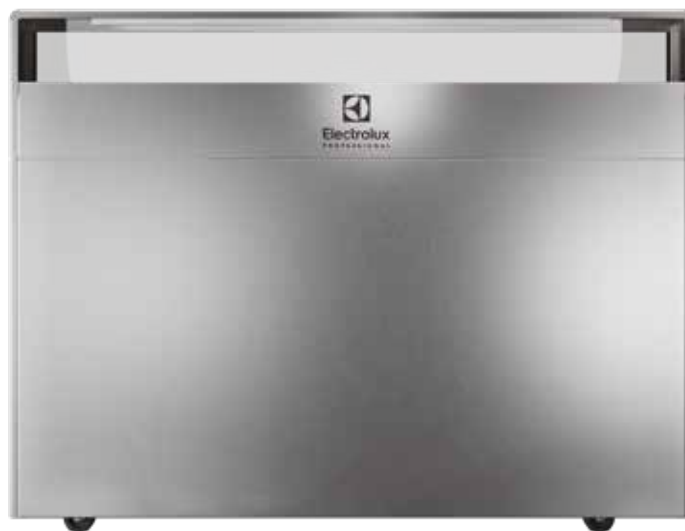
Versione standard in acciaio inox di alta qualità (AISI 304)

Scegli tra sei diverse finiture* e adatta la postazione di cottura mobile alle tue esigenze estetiche.