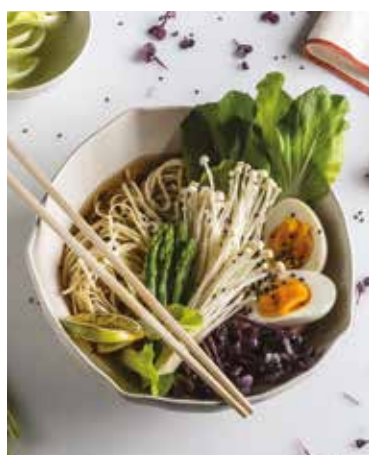
Ramen di verdure