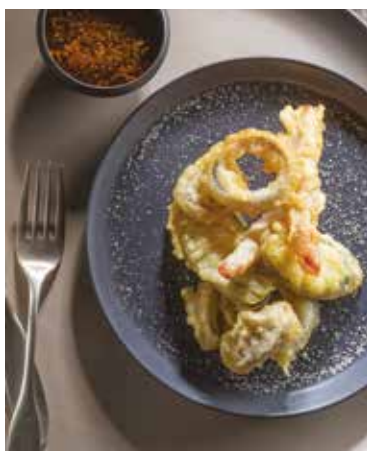
Tempura di verdure con wok LiberoPro