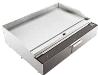
Fry top XL