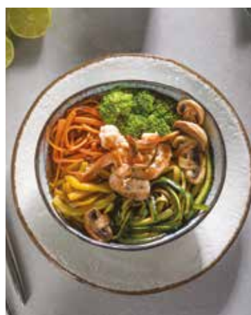
Gamberetti con verdure