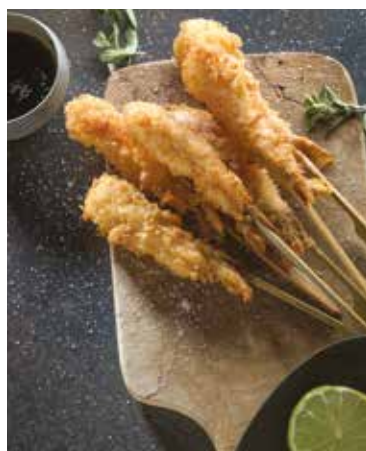
Gamberetti impanati con wok LiberoPro