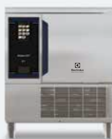
2. Abbattitore SkyLine Chill s 30 kg