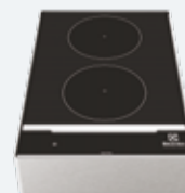
3. Induzione LiberoPro doppia zona