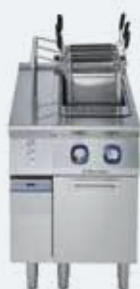
1. Cuocipasta XP700